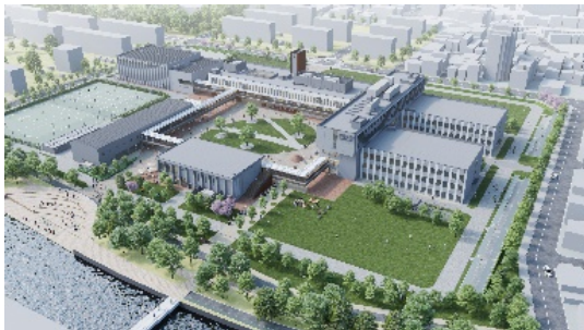
東京あだちキャンパス開設イメージ

新キャンパス開設により、文教大学は従来の越谷・湘南両キャンパスを含めた首都圏1都2県にまたがる「トリプルキャンパス」の体制になります。