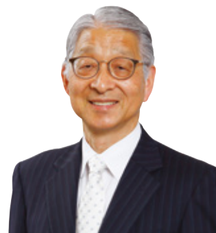
学校法人 文教大学学園 理事長